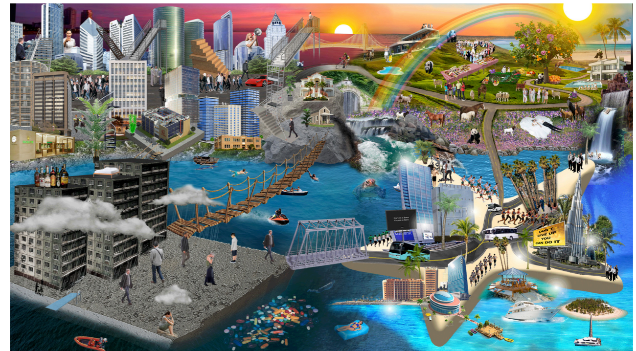
Mental Park Emma Verhoeven

Heb jij ideeën over hoe de kunstwerken of de aanpak van de Self Design Ateliers binnen jouw praktijk zouden kunnen landen, of zie je waardevolle manieren om de thematiek verder te verkennen? We komen graag met je in contact.